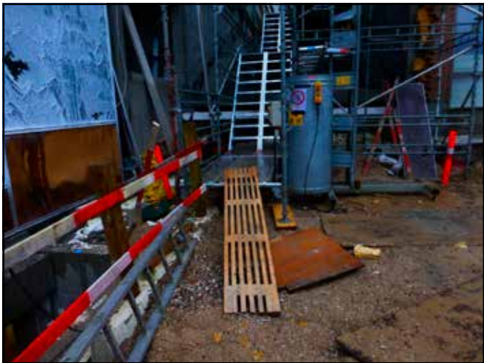
Byggeledelse i det 2100 århundrede: Carlsberg Byen/„Stairways to Skadestuen“ af projektlederfirmaet Arpe og Kjeldsholm A/S.