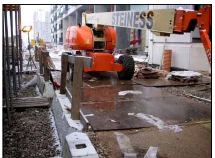
Byggeledelse i det 2100 århundrede: Grønttorvet i Valby/Arbejdstilsynet fandt ingen fejl og mangler (hvilket efterfølgende, på Byggefagenes foranledning, førte til en ændring af tilsynets besøgsprocedure).