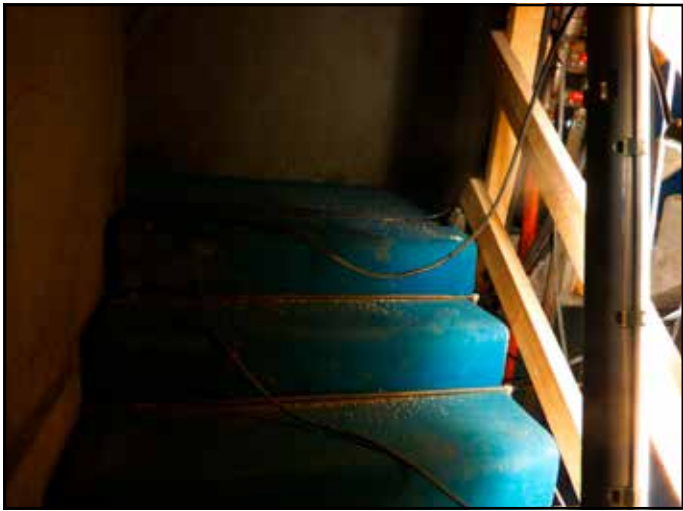
Byggeledelse i det 2100 århundrede: Vinder i kategorien „Vi snubler på arbejde“ – flot snublefælde og en herlig dunkel belysning. (Byggeri i Sydhavnen).