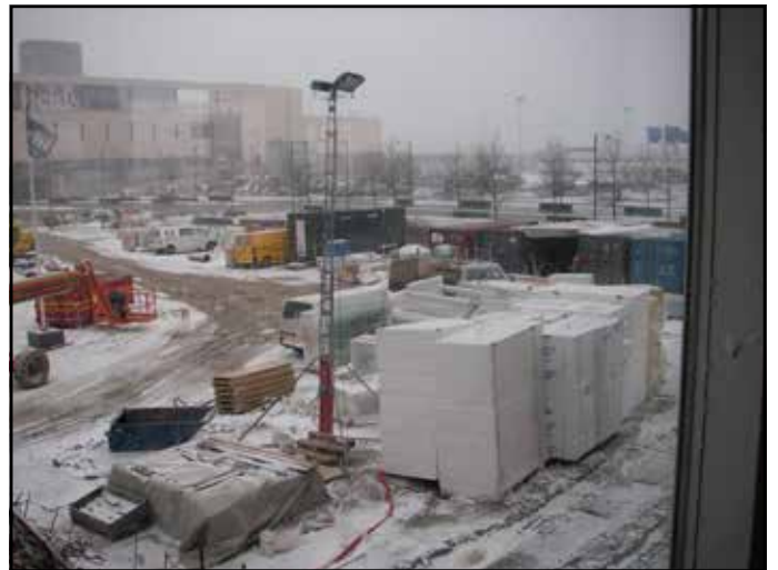
Byggeledelse i det 2100 århundrede: Byggeri overfor Fields på Amager. Adgangsvej? – I kan da bare bruge ski eller skøjter.