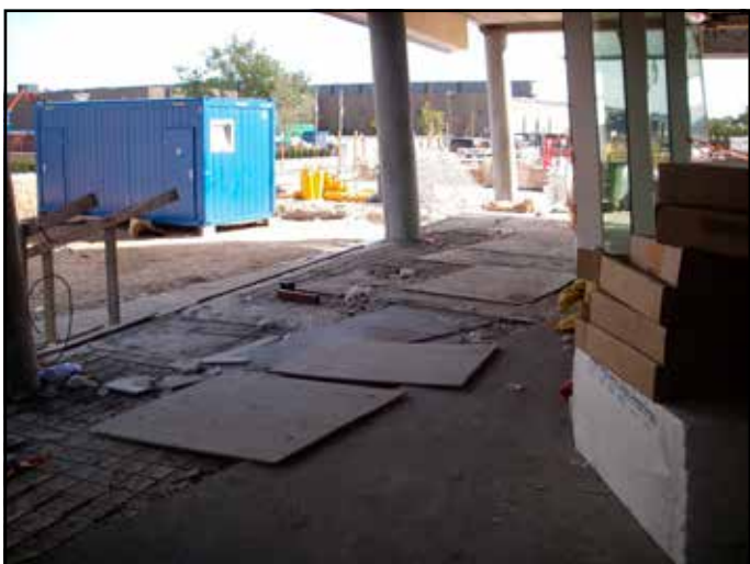
Byggeledelse i det 2100 århundrede: Iflg. dagbladet Børsen, scorede Saxo Banks 2 ejere personligt 197,5 mio. kr. på byggeriet af Saxobanks domicil – hvor mange arbejdsskader mon byggefolkene scorede?