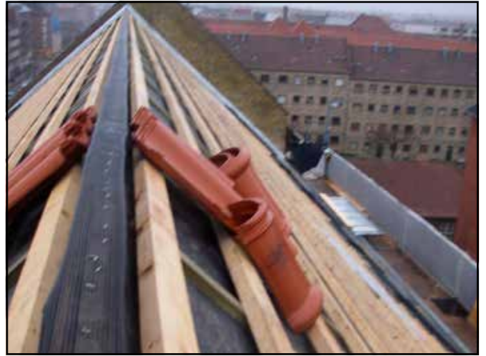
Byggeledelse i det 2100 århundrede: Nedstyrtningsfare? – tja..bum..bum Tagrenovering i København.